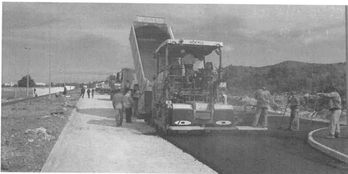
Zavešno asfaltiranje prometnice u zoni Podi

Završeni su radovi ugovoreni lani u listopadu mjesecu između grada Šibenika i zajednice ponuditelja tvrtki Čigra d.o.o. i Reliance d.o.o. koji se odnose na izgradnju prometnice s kompletnom infrastrukturom u dužini od 607 m. – tzv. 4. etapa izgradnje industrijske zone Podi. Radovi su iznosili 10.142.44 HRK od čega bespovratna sredstva Europskog fonda za regionalni razvoj iznose 7.606.833 HRK ili 75% .