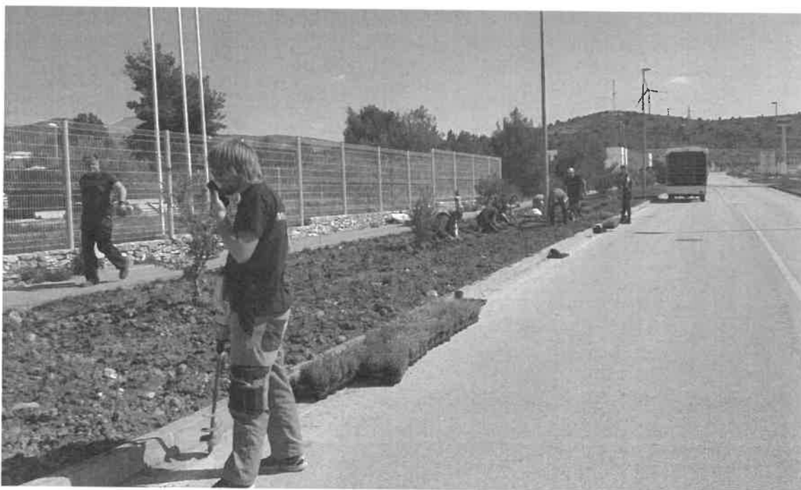
Sadnja na zelenim površinama u zoni Podi

U sklopu istog projekta realizirano je hortikulturno uređenje zelenih površina te su zasađene: masline, lovor, ružmarin i lavanda, na ukupnoj površini većoj od 40.000 m 2 .