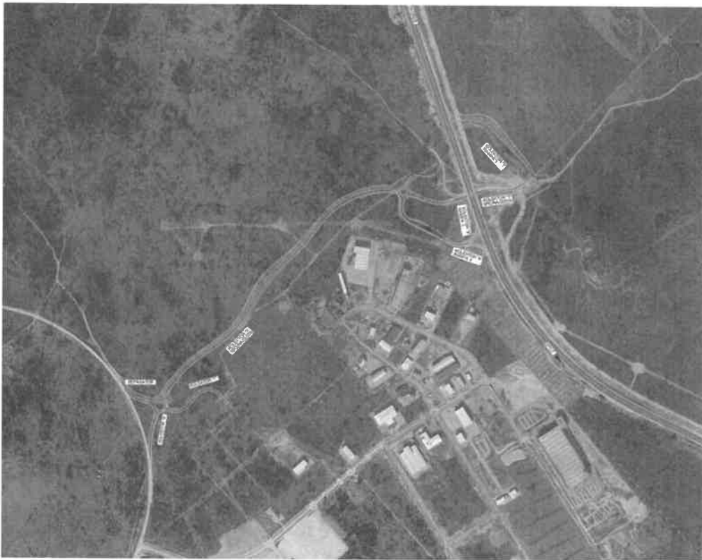
Planirani zahvat izgradnje čvora Šibenik Podi

da je uređenje spoja na autocestu i priključnih rampi nužna. Planirani zahvat se nalazi u neposrednoj blizini zone Podi a spojna cesta će biti duga 800 m.