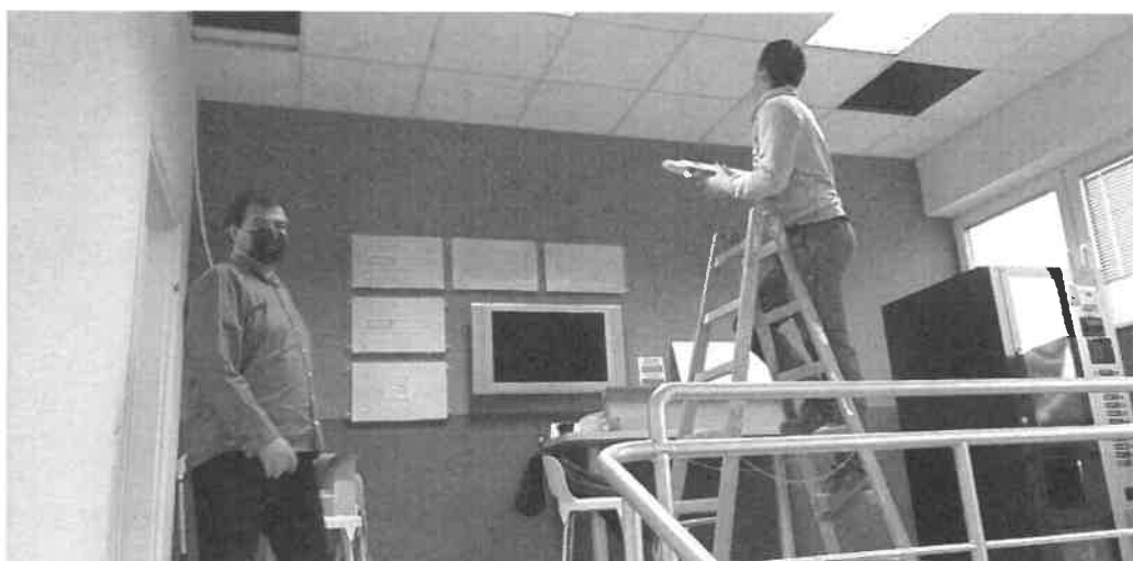
Postavljanje UV-C lampi u PIN-u Šibenik

U godinama u kojima smo suočeni s pandemijom bolesti COVID 19 iz našeg inkubatora je proizašla ideja koja se i ostvarila na tržištu. Poduzetnici iz različitih djelatnosti već postojeću tehnologiju prilagodili su novim uvjetima. Pokrenut je projekt „UVready“, pokrenuli su ga vlasnici tvrtki Energy 4People, F-N Elektroinstalacije i Bubamara. Tvrtka konstruira manje sustave za uništavanje virusa i bakterija UV svjetlošću. Tvrtka UVready kao doprinos u borbi protiv koronavirusa donirala je Općoj bolnici Šibensko-kninske županije četiri UV-C svjetiljke OSRAM AirZing PRO. Bolnica je i ranije imala UV-C lampe no ove donirane su modernije. Lampe su postavljene u jednu operacijsku salu, izolacijski boks u intenzivnoj jedinici i dvije u kontejner za trijažu bolničkog prijema.